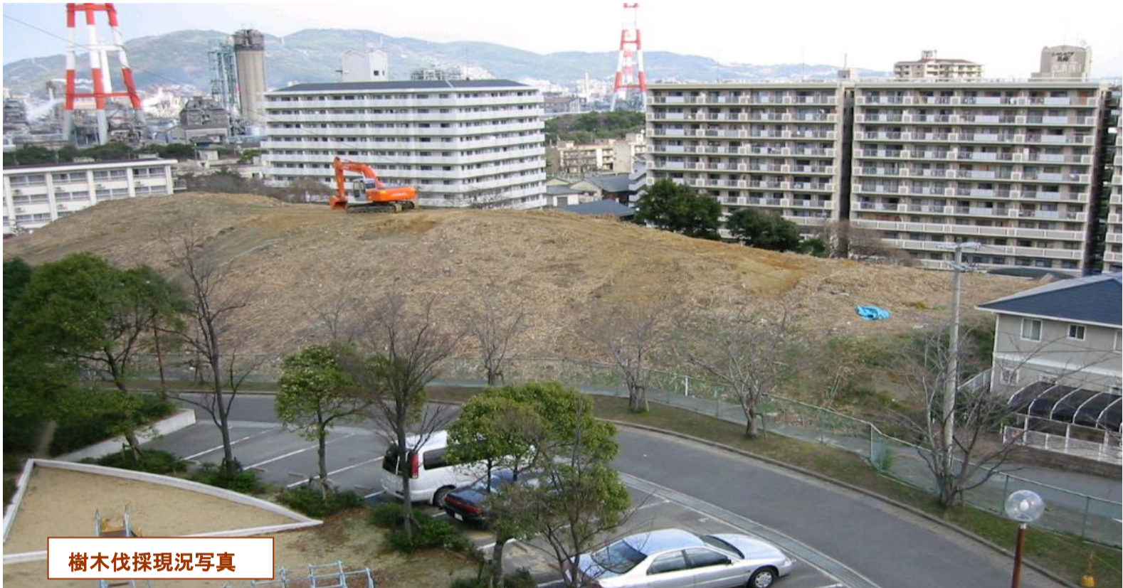
樹木伐採現況写真